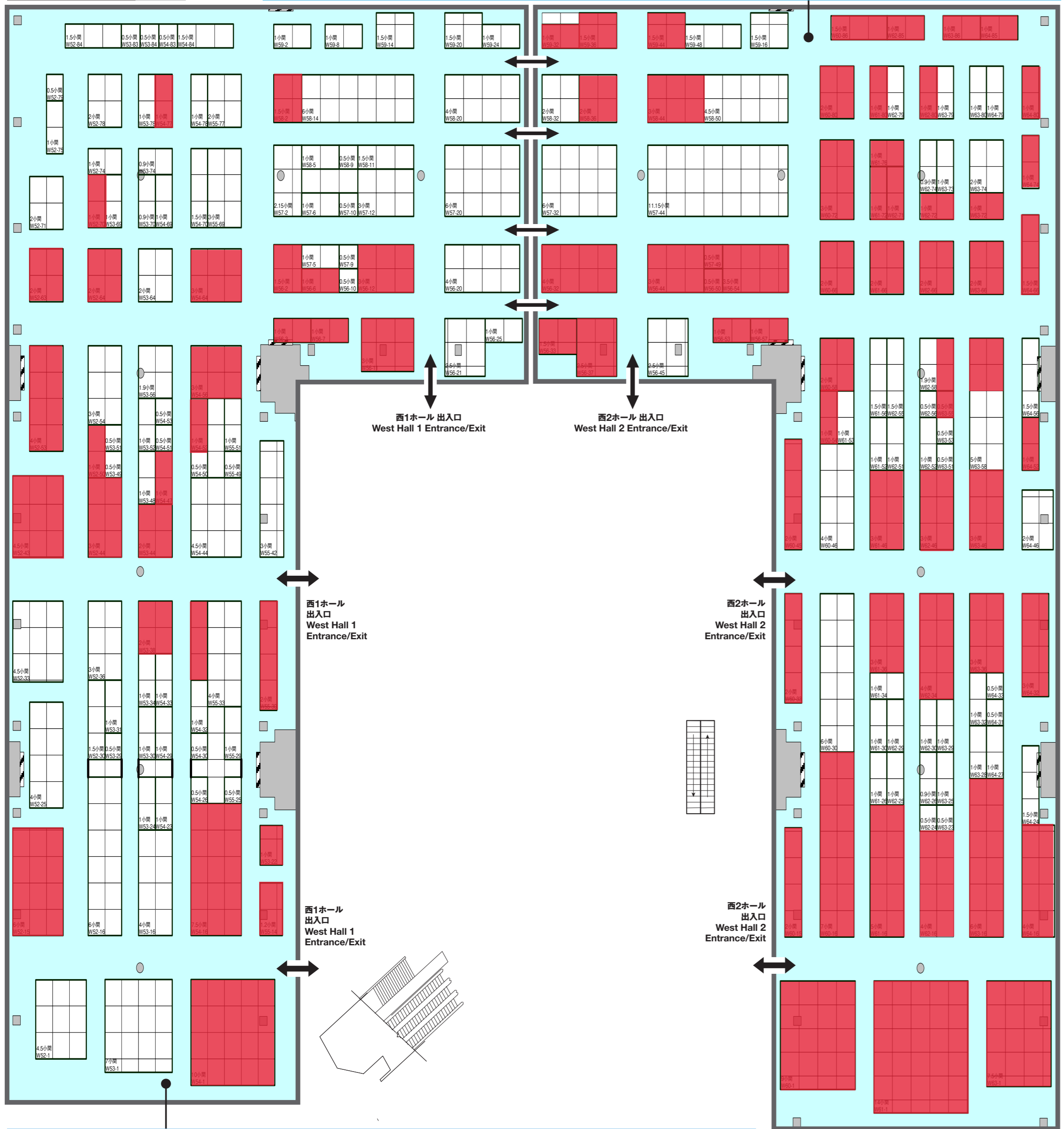
FACTORY INNOVATION WEEK 2024 第8回 ロボデックス ロボット 開発・活用展 8th RoboDEX Robot Development & Application EXPO