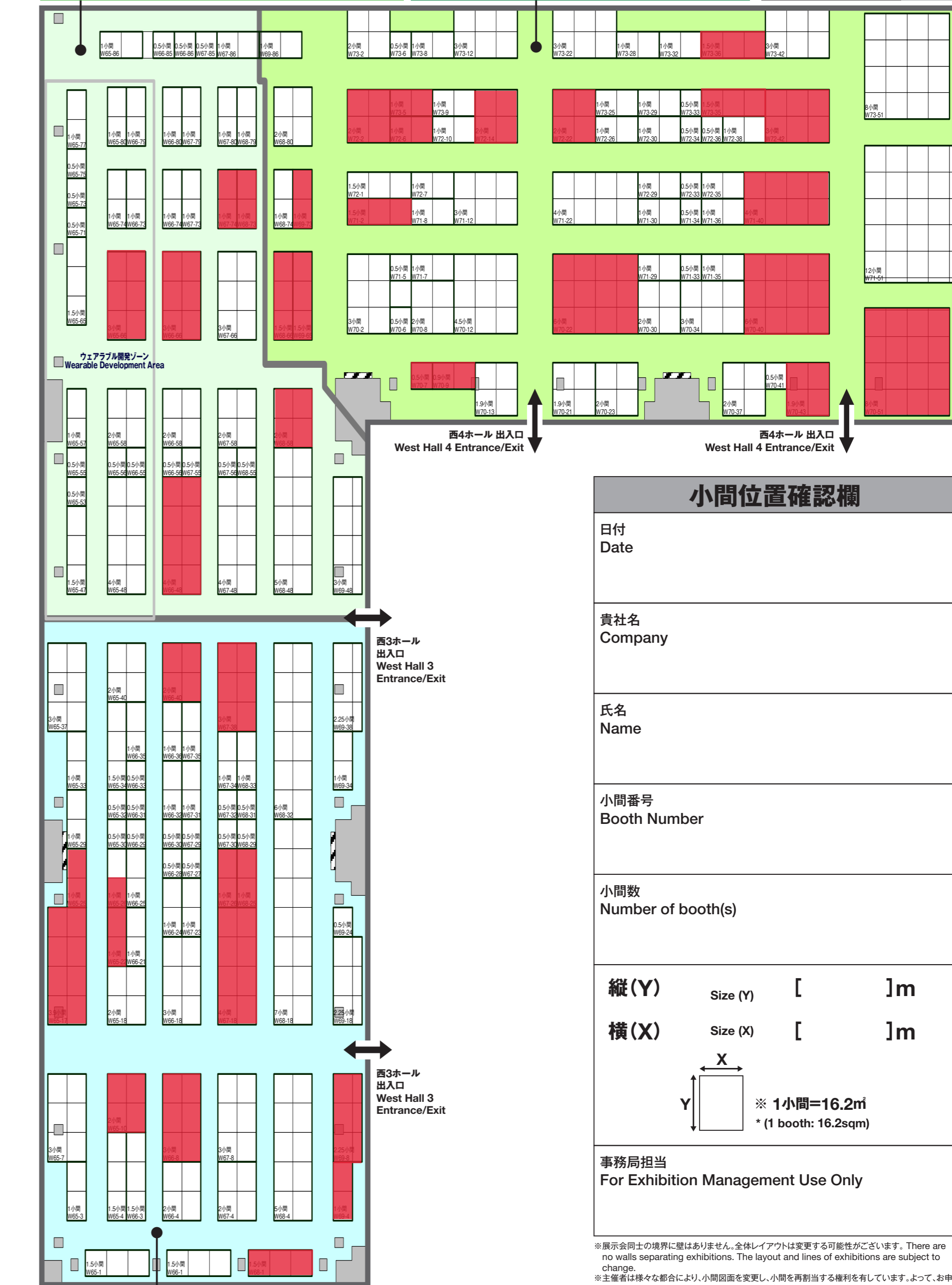
FACTORY INNOVATION WEEK 2024 第2回 グリーンファクトリー EXPO 2nd Green Factory Expo